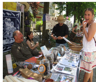
Fête des associations