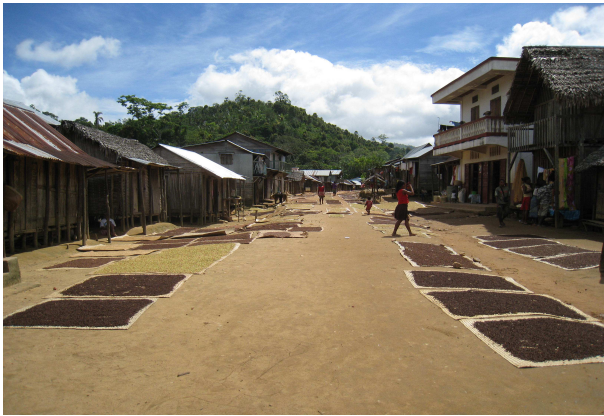
Les matériaux de construction et la diversité des cultures sont des indicateurs de développement.

et bienvenus aux nouveaux adhérents qui, s'ils le désirent, peuvent nous demander les bulletins précédents.